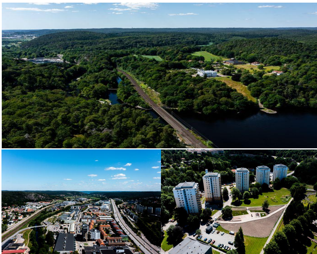
Partille växer – Drönbilder över Partille kommun.