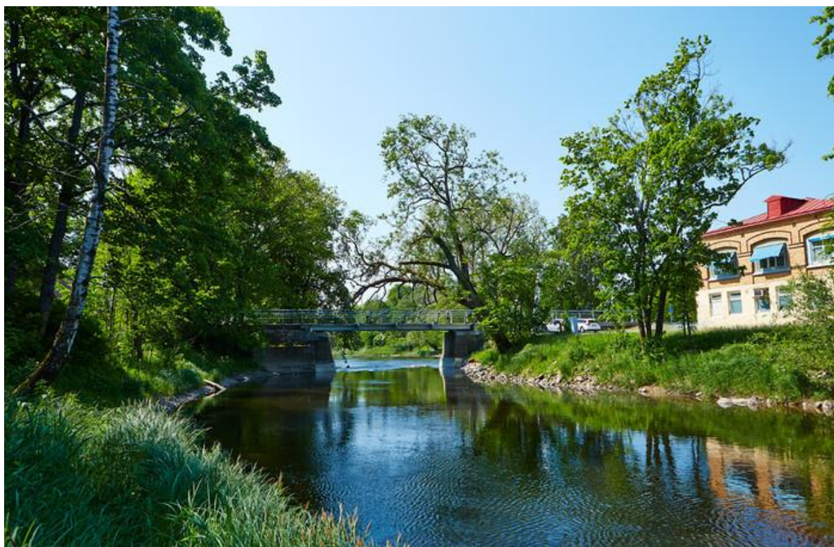
Säveån vid Kyrkbron och Kniven