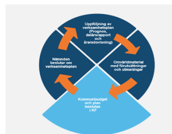
Kommunens planerings- och uppföljningsprocess.

Kommunfullmäktige fastställer övergripande målområden och indikatorer för hela kommunen samt anslår resurser till nämnderna i kommunens budget. Budgetbeslutet tas enligt ordinarie tidplan i juni månad. Fullmäktige följer upp budgeten vid två tillfällen under året, vid delårsbokslutet och i kommunens årsredovisning vid årsskiftet. Nämndernas verksamhetsplan och årsredovisning. I verksamhetsplanerna bryter nämnderna ner kommunfullmäktiges målområden och indikatorer, där så är möjligt, till nämndmål samt fördelar verksamhetens resurser. Avdelningar och enheter arbetar fram aktiviteter för sina verksamheter utifrån nämndernas mål. Nämndernas bedömning av måluppfyllelse utgår från utfallet av valda indikatorer samt analys av dessa och verksamhetens utförda aktiviteter.