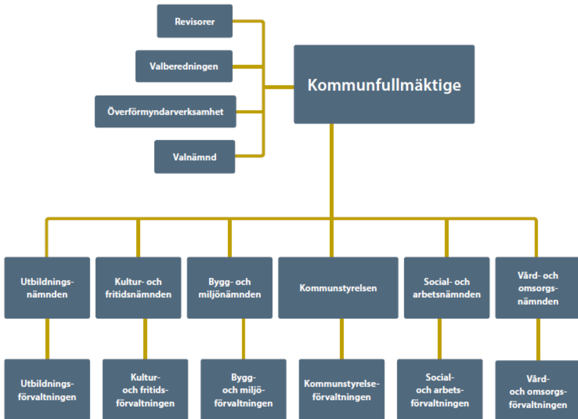
Kommunens nämnds- och förvaltningsorganisation.