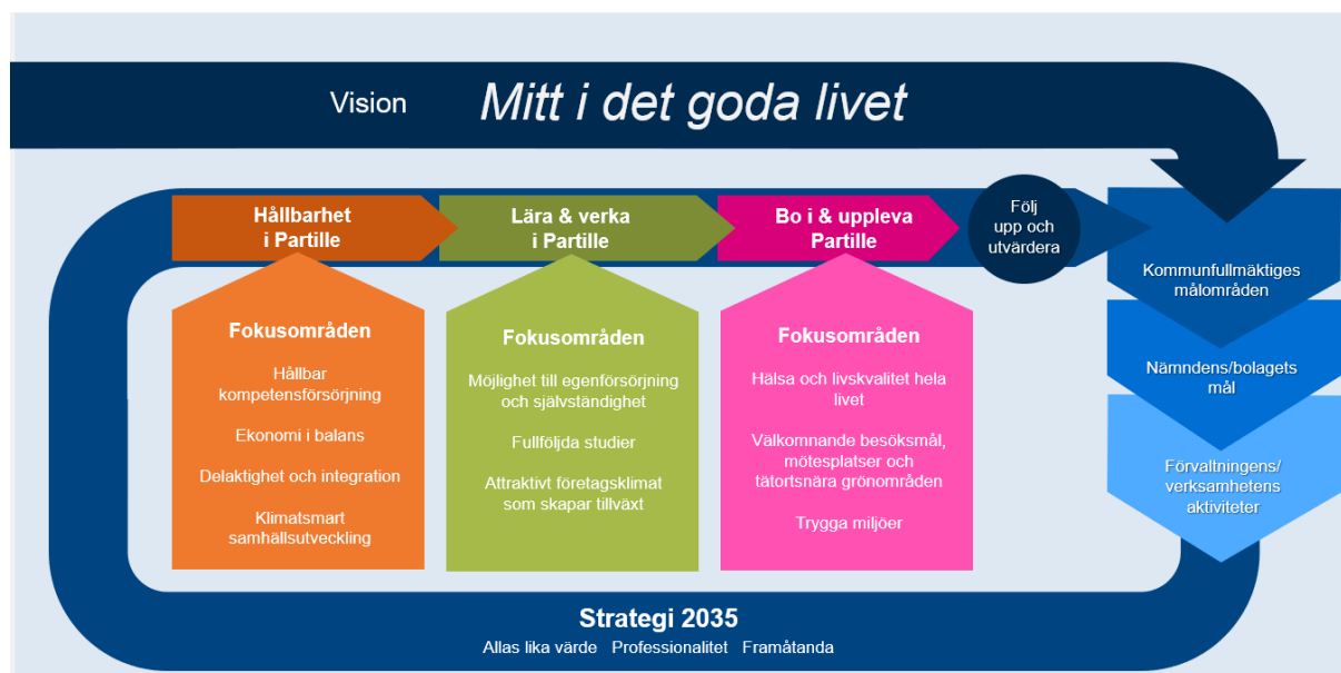
Kommunenkoncernens styrmodell med mål- och fokusområden

Uppföljning av kommunens och kommunens bolags verksamhetsmässiga och finansiella målområden görs vid del- och helårsbokslut.