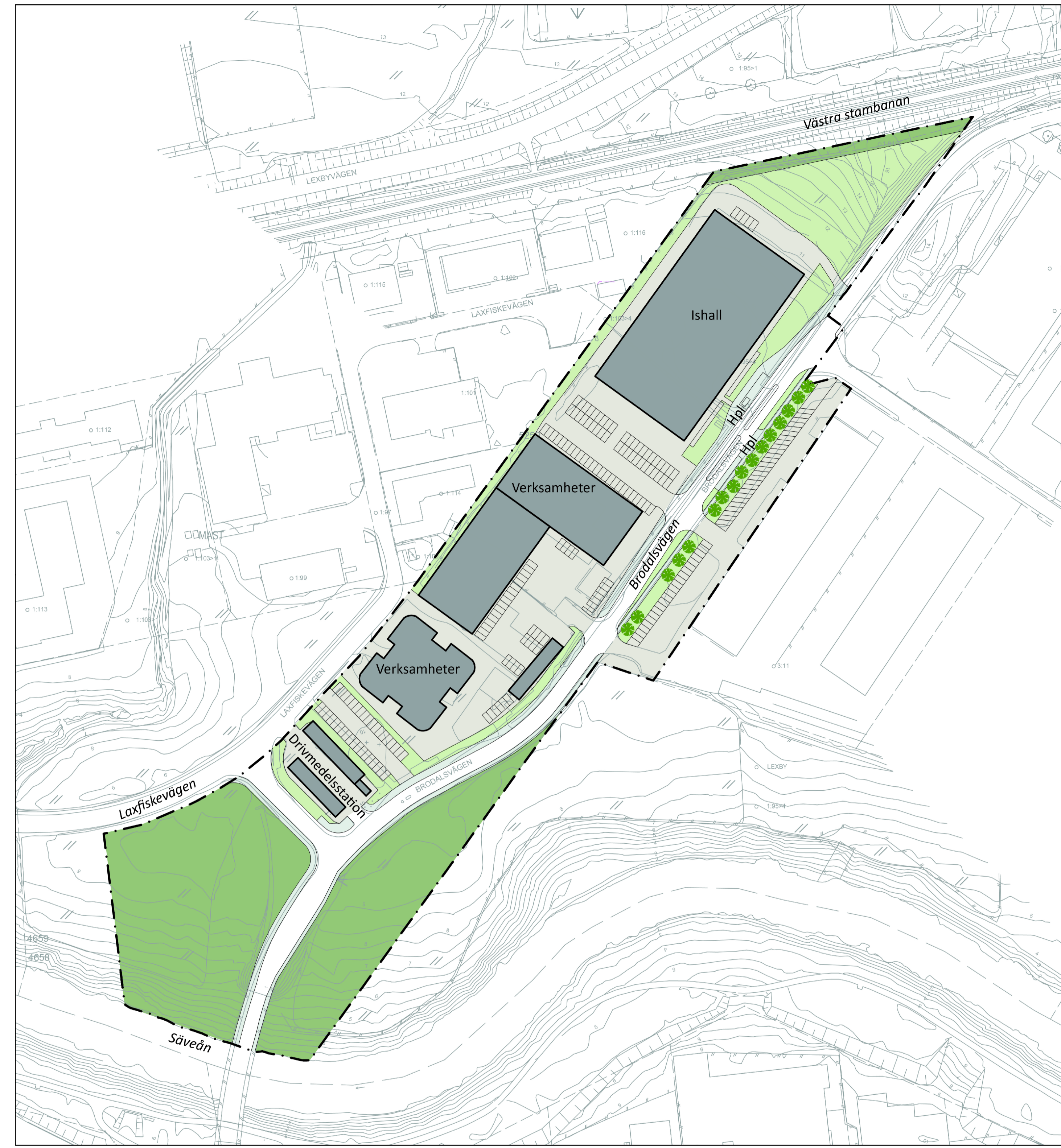
Illustrationsplan alternativ 2