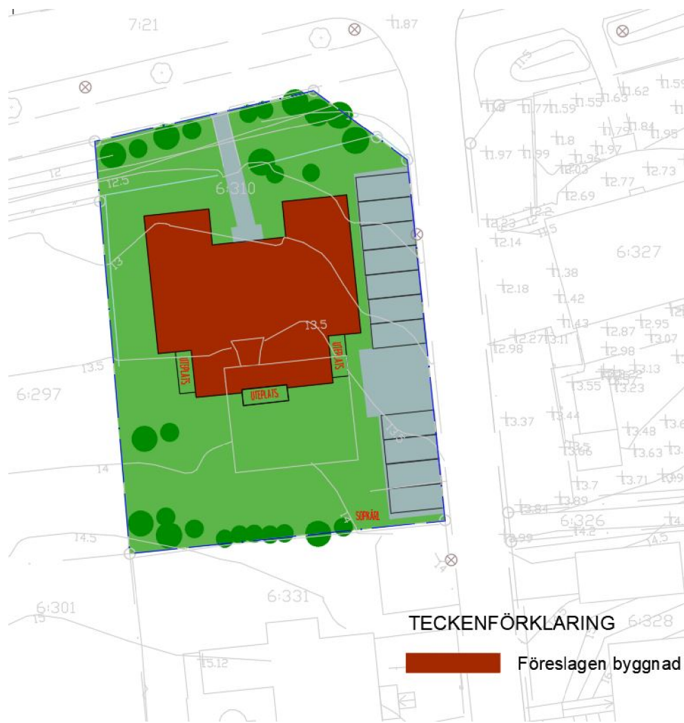
Illustrationsplan, ej skalenlig