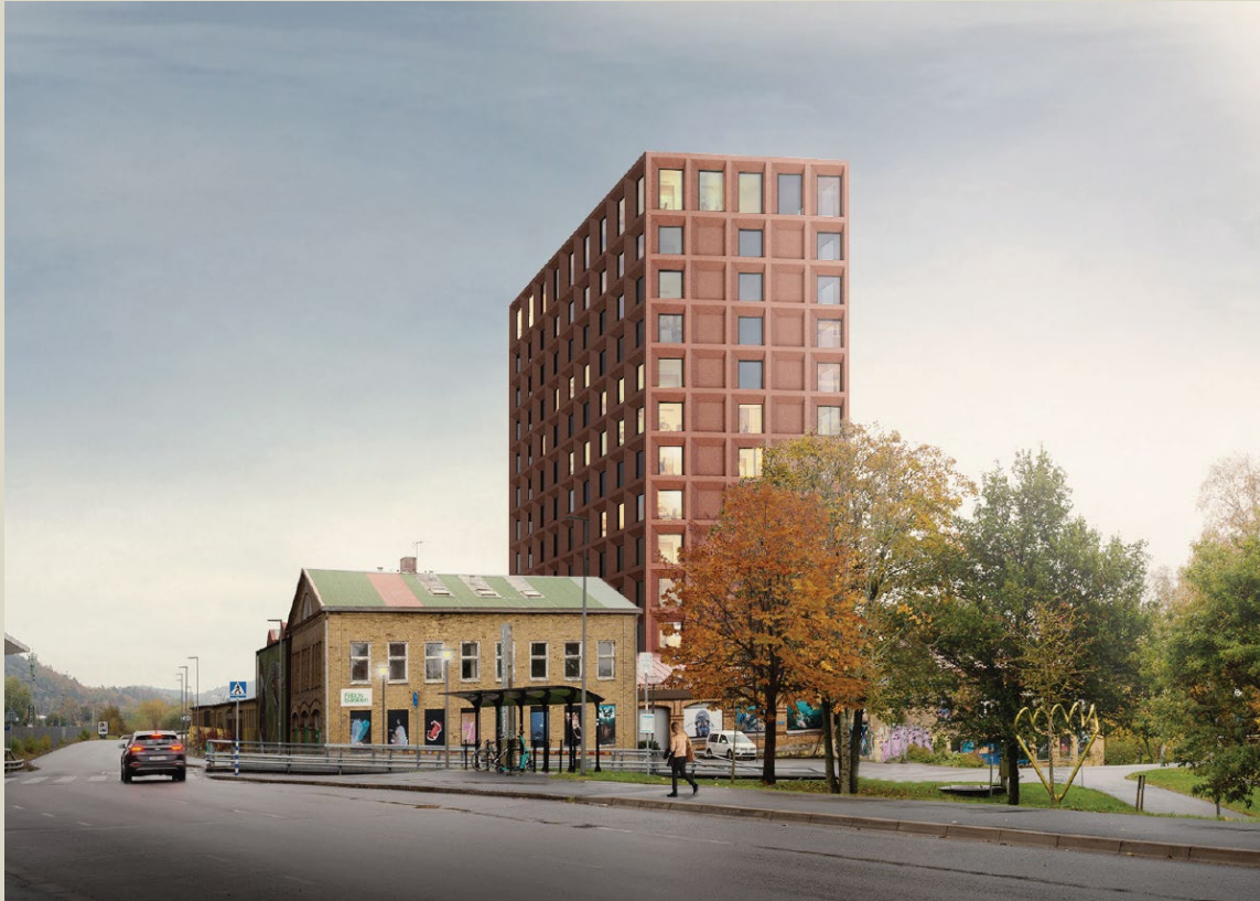
Vy 1 mot öster sett från Stationsvägen