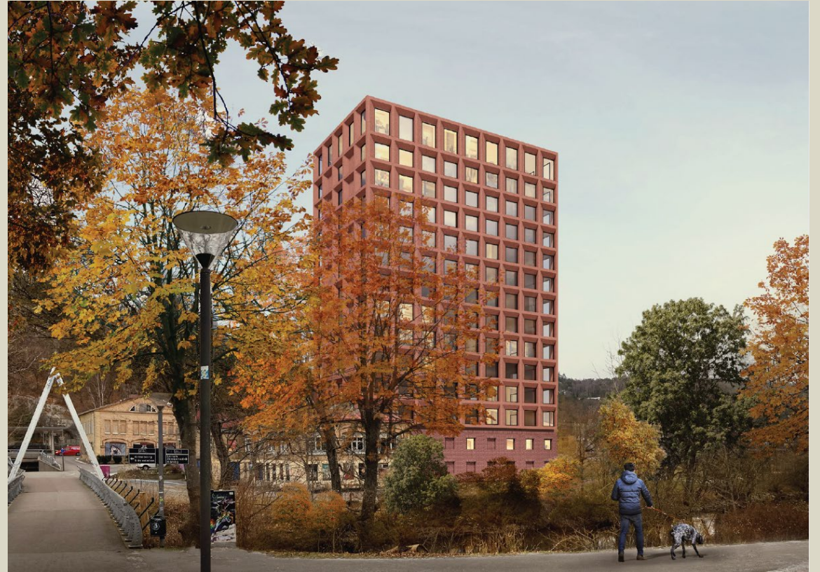
Vy 2 mot norr sett från Å-torget