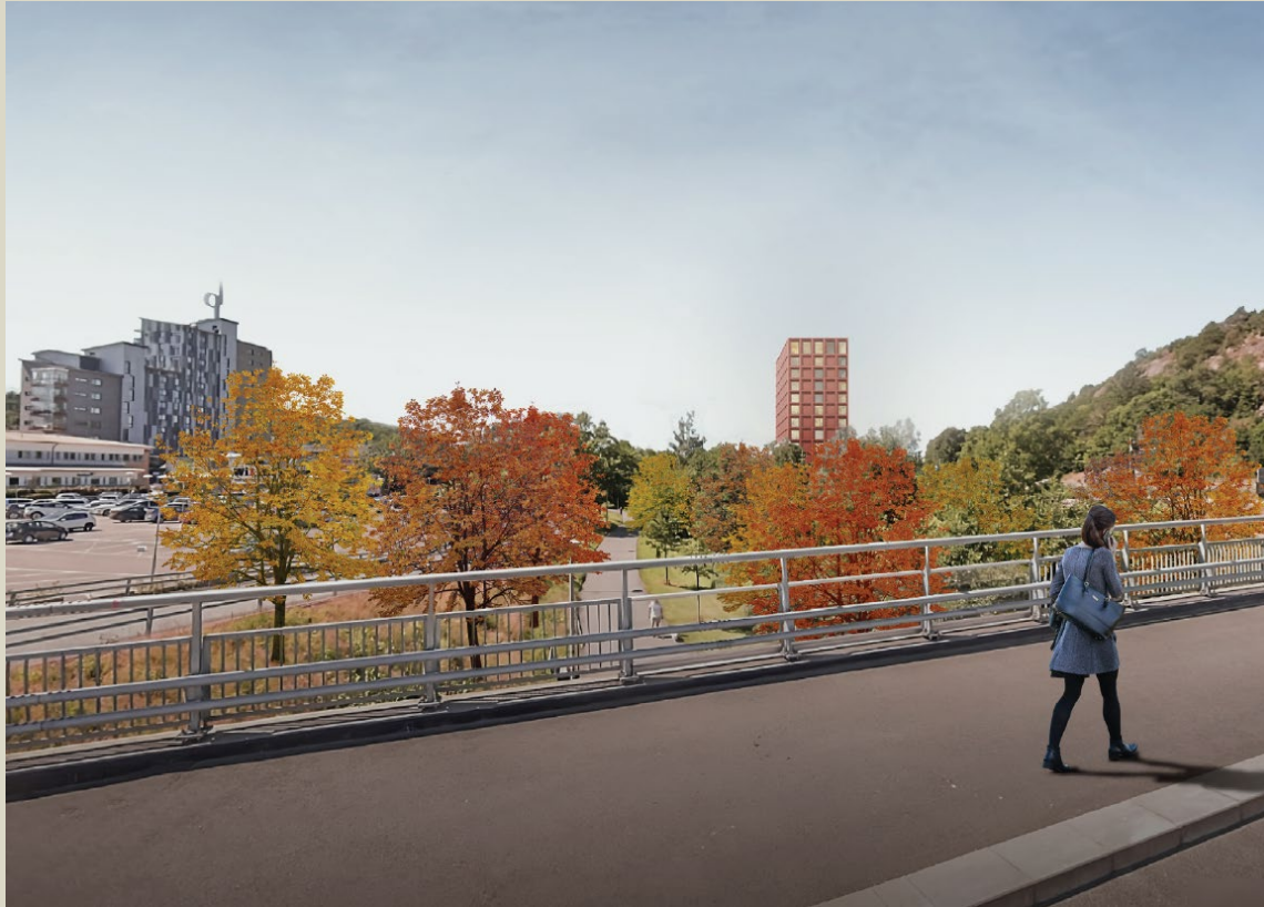
Vy 3 mot väster sett från Yllebron