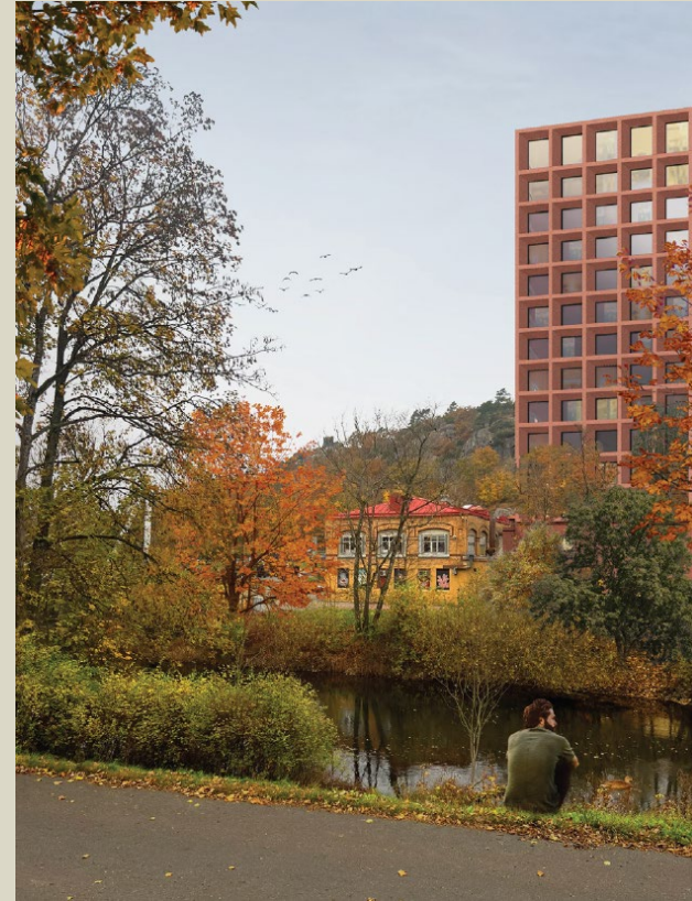
Vy 4 mot norr sett från Å-promenaden söder om Säveån