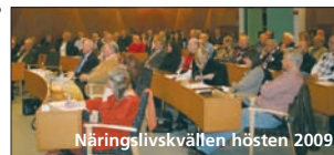
Näringslivskvällen hösten 2009