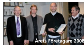
Årets Företagare 2008

Efter årsmötesförhandlingarna presenteras Årets Företagare i Partille 2009 och Ung företagsamhet vid Porthällagymnasiet premieras. Kallelse sändes till Företagarnas medlemmar i februari.